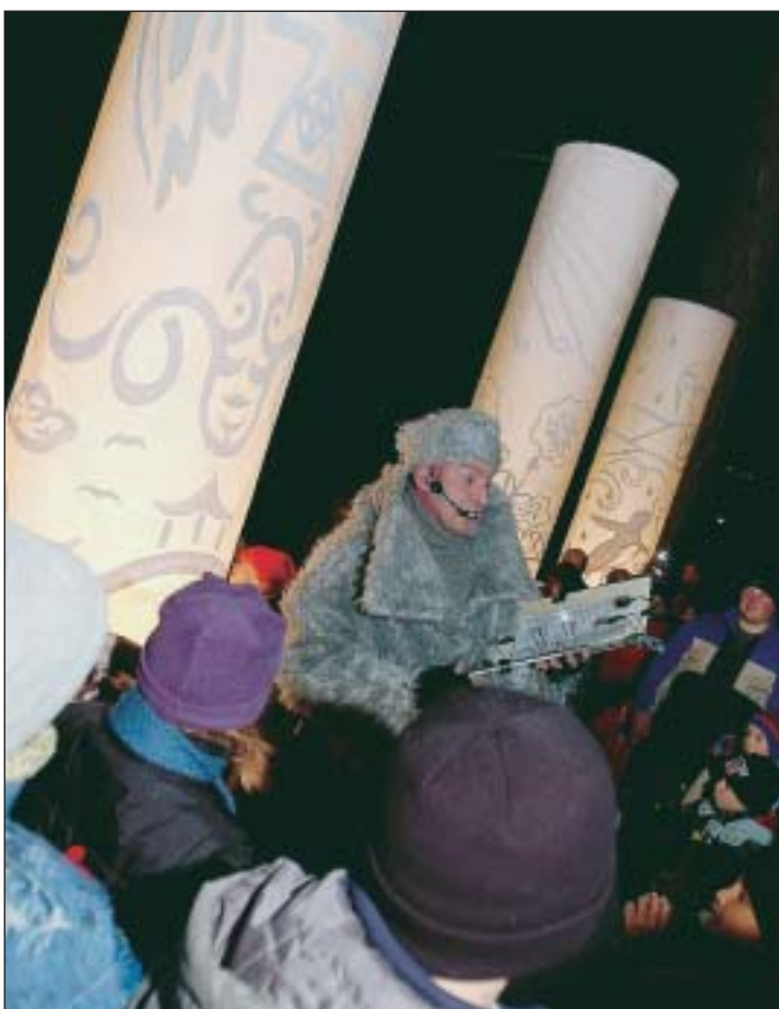
Avec le neuvième menhir illuminé, la forêt devient magique et le public, toujours nombreux, apprécie.

LA CHAUX-DE-FONDS Le jeune Celte a été catapulté au-dessus des menhirs et a fait une descente en piqué. Comme le conteur glissant de son arbre